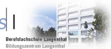
Berufsfachschule Langenthal Bildungszentrum Langenthal