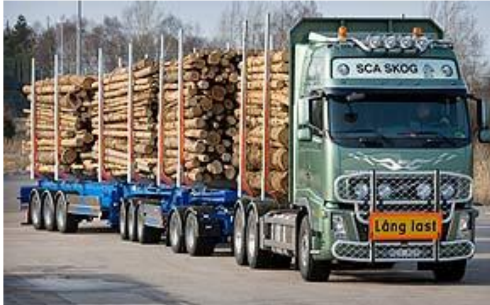
Der «Schweden-Kombi», 90 Tonnen, 30 Meter