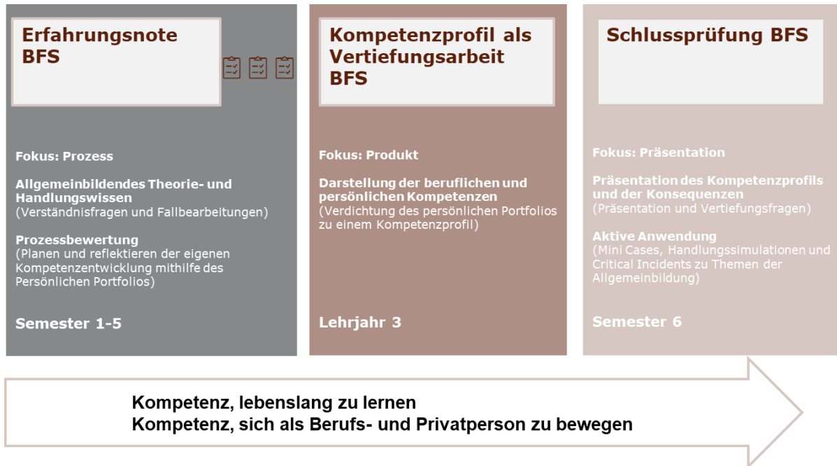
Abbildung 3: Qualifikationsverfahren Allgemeinbildung – Elemente und Inhalte

In den nachfolgenden Kapiteln werden diese drei Elemente detailliert erläutert.